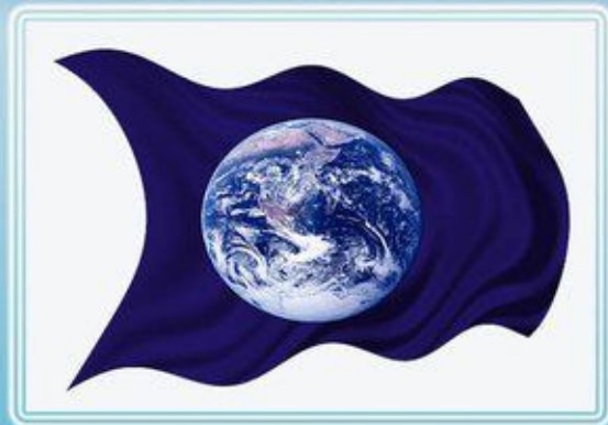
Эмблема и флаг Международного Дня Земли

Основателем этого Дня считается Дж. Стерлинг Мортон, который в 40-х годах XIX века развернул кампанию по пропаганде посадки деревьев в штате Небраска /США/. Предложение Дж. Мортон было одобрено и получило широкую поддержку жителей штата: в первый День Дерева было высажено около миллиона деревьев. В 1882 г. День